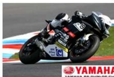
YAMAHA YAMAHA R6 DUNLOP CUP

„Diese Rennveranstaltung verlief für mich enttäuschend. Mit den ständig wechselnden Wetterbedingungen kam ich nicht klar. Startplatz 22 in der Quali auf nassen Belag war das Ergebnis meiner mangelnden Risikobereitschaft. Im Rennen musste ich mich im hinteren Pulk erst einmal mit den nun trockenen Verhältnissen anfreunden. Im letzten Renndrittel konnte ich ordentliche Rundenzeiten fahren und auf Platz 16 das Rennen beenden. Alles in Allem ein Ansporn für mich, die kommenden Rennen mit Motivation und Entschlossenheit anzugehen.“